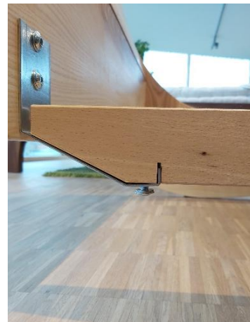
Abb. 6 + 7